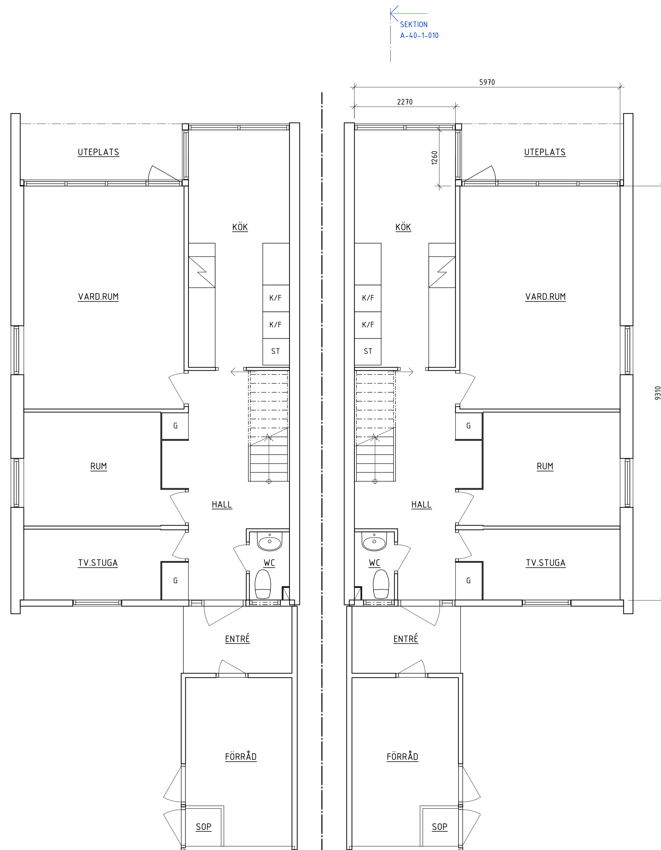
PLAN - BOTTENVÅNING

Se även Lättgörelse Samfällighets ritningsarkiv för originalritningar.