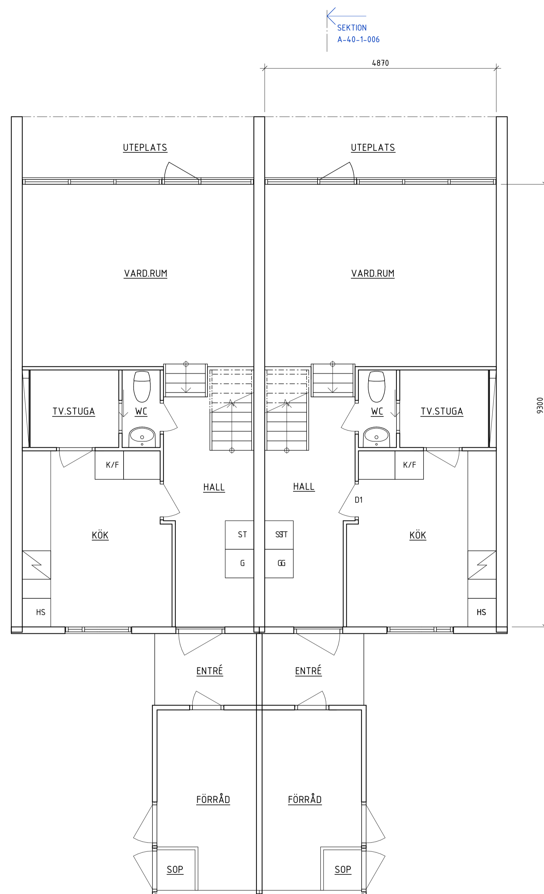
PLAN - BOTTENVÅNING

Se även Lättglets Samfällighets ritningarkiv för originalritningar.